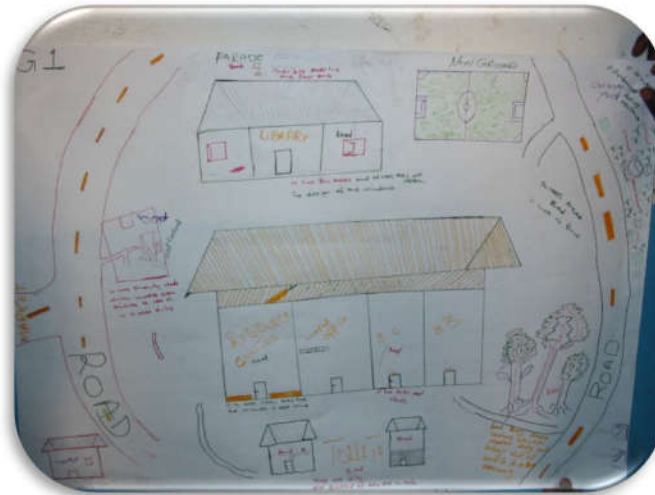
Exemple d'un plan d'école créé par des enfants en Zambie