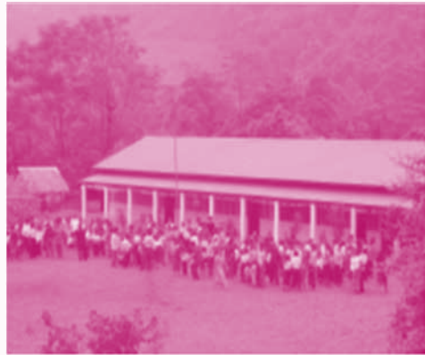
ໂຮງຮຽນປະຖົມບ້ານປາກກໍ, ເມືອງຫຼາ, ແຂວງ ອຸດົມໄຊ