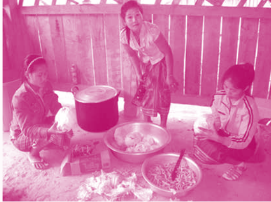
ຊຸມຊົນກຳລັງແຕ່ງອາຫານທ່ຽງໃນໂຮງຮຽນ ແຂວງອຸດົມໄຊ

ເພີ່ມຂຶ້ນ ເຊັ່ນ: ອັດຕາເຂົ້າຮຽນໃໝ່ເພີ່ມຂຶ້ນ 2.1–8.4%, ອັດຕາເຂົ້າຮຽນສຸດທິເພີ່ມຂຶ້ນ 0.4–11.4%, ອັດຕາການປະລະຫຼຸດລົງ 2–6.2%, ອັດຕາເລື່ອນຂັ້ນເພີ່ມຂຶ້ນ 1.6–7.6%, ອັດຕາຄ້າງຫ້ອງຫຼຸດລົງ 0.3–2% ແລະ ລອດເຫຼືອໃນຊັ້ນ ປ. 5 ເພີ່ມຂຶ້ນ 3.7–13.6%.