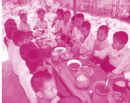
ນັກຮຽນກຳລັງກິນອາຫານທ່ຽງ