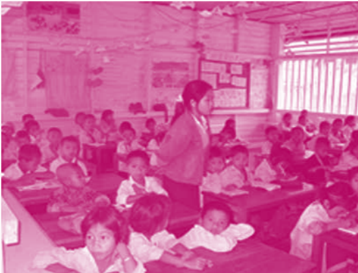
ຄູເດັກຍິງຊົນເຜົ່າ

ຜົນໄດ້ຮັບຂອງໂຄງການປະກອບມີ: ການປຸກສ້າງຄູໂຮງຮຽນທ້ອງຖວມ ແລະ ທ້ອງຄວບ ຈຳນວນ 504 ຫຼັງ ແລະ ປຸກສ້າງທ້ອງການໃຫ້ແກ່ເມືອງທີ່ຍັງບໍ່ທັນມີ ຈຳນວນ 43 ຫຼັງ; ສະໜອງອຸປະກອນການຮຽນ ແລະ ປຶ້ມຄູ່ມືຄູເພີ່ມກ່ຽວກັບການສອນທ້ອງຄວບ, ພາສາລາວໃຫ້ແກ່ເດັກຊົນເຜົ່າ, ຫັກສະຊີວິດ ຈຳນວນ 630,549 ຫົວ ຊຶ່ງແຈກຢາຍໃນເຂດ ເປົ້າໝາຍຂອງໂຄງການ. ສ້າງຄູຊົນເຜົ່າໄດ້ 486 ຄົນ, ຍິງ 326 ຄົນ (ຄູຊົນເຜົ່າທຸກຄົນໄດ້ຮັບໂກຕາ ໃນການສັງກັດເປັນຄູສອນ ແລະ ກັບໄປສອນຢູ່ບ້ານຕົນເອງ), ສ້າງຄູສຶກສານິເທດໄດ້ຈຳນວນ 77 ຄົນ ໃນ 52 ເມືອງເປົ້າໝາຍຂອງໂຄງການ ເພື່ອໃຫ້ການຊ່ວຍເຫຼືອ, ດູແລ ແລະ ແນະນຳຄູສອນທ້ອງຄວບ, ສ້າງຄູຝຶກໄດ້ຈຳນວນ 260 ຄົນ ເພື່ອໄປຝຶກອົບຮົມໃຫ້ຄູສອນ ຊັ້ນປະຖົມສຶກສາ 4.100 ຄົນ ໃນການສອນທ້ອງຄວບ ແລະ ນຳໃຊ້ອຸປະກອນການຮຽນການສອນ ເພື່ອສອນເດັກຊົນເຜົ່າ