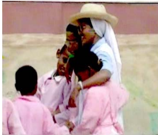
Fanovàna ny rafi-panabeazana