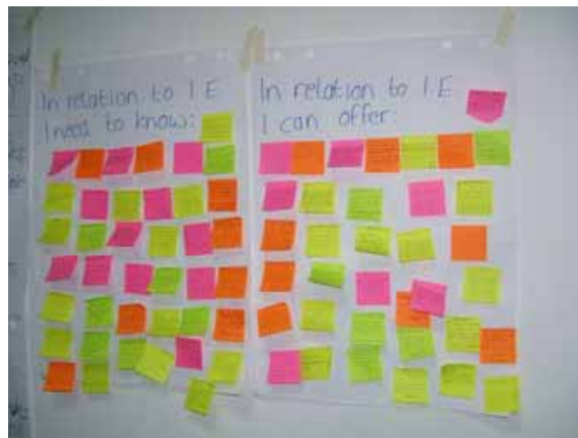
Mtandao (mchezo) wa 'swap-shop'

Baada ya aibu kidogo, washiriki walianza kutafuta watu wanaolingana kwa mahitaji yao na majadiliano ya moja kwa moja yakafuata. Makundi madogomadogo ya washiriki yalitengenezwa yenye mahitaji sawa na kuanza kujiunga na vikundi vya wawili wawili wenye kutegemeana. Kwa kuwa hii ilikuwa ni kama mchezo wa kuvunja ukimya ilitumia kama dakika 15 ambazo hazikutosha kwa washiriki kumaliza mazungumzo yao. Hata hivyo mwendesha-warsha aliwaambia washiriki kuendelea na majadiliano kwa wiki yote wakati wa vipindi vyote vya mapumziko. Tathmini ya mwisho wa warsha iliashiria kuwa washiriki wengi