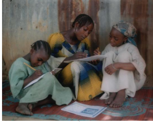
دانلود مامون ، المنظمة النيجيرية لتمكين الفتيات الأطفال GCEN ، نيجيريا