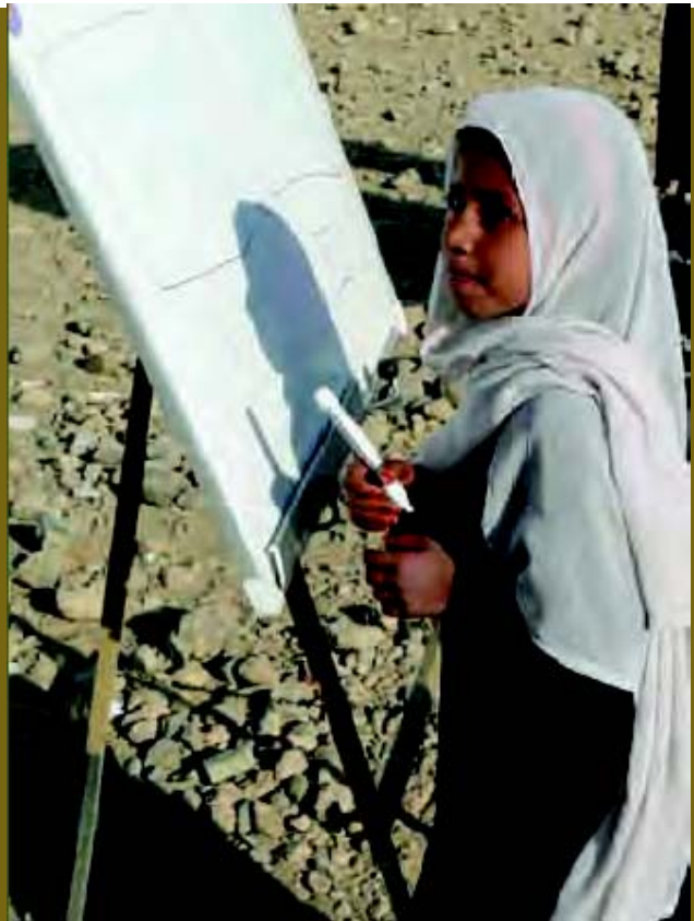
د سوډن د ماشومانو د ژغورني موسسي له لوري