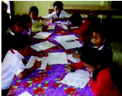
د پېلې او سېس او تايختا مارچ نومبر ۲۰۰۹

پدې مقاله کې نیت لرو چې په لنډه توګه دغه پروژه د هغه کسانو لپاره معرفي کړو چې احياناً له هغه څخه بې خبره دي او ورسره به ځينې وروستنې فعاليتونه هم توضيح کړو.